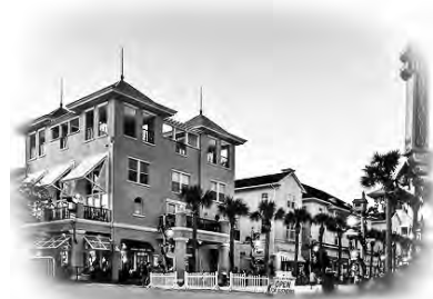
隣町のオールドタウン地区も必見

カ所以上、豪華なリゾートホテルも林立する全米屈指の観光・保養都市として知られています。一方で手つかずの自然も多く残り、自然保護区が多数指定されているというのです