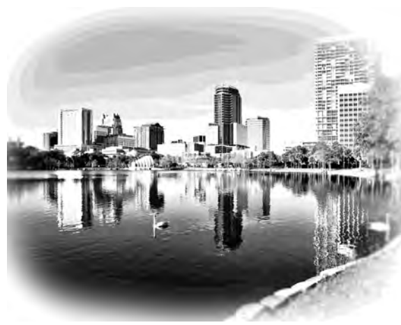
美しいオーランドの街

から驚きます。デイトナビーチなど近郊の海岸にはビーチリゾートが発展しており、世界中から多くの観光客が訪れています。加えてスーパーボイズグループのバックストリートボイズの故郷ということから、多くのファンも訪れていることでしょう。こうした人気の都市となったのには一年を通して温暖な気候であることが要因の一つと考えられますが、近年ハリケーンの被害が深刻になり問題となっています。