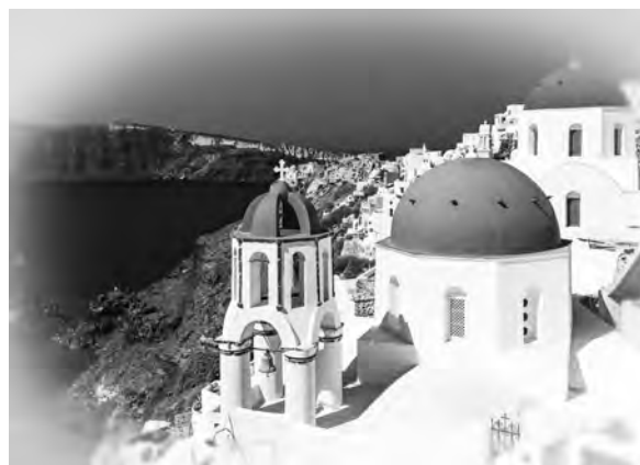
サントリーニ島と言えばこの景色

レストランや土産物屋で賑わっています。そのフィラからバスで20分ほどの場所にあるイアには4つ星以上のホテルが集