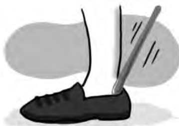
靴べらを使いましょう

ばれ、靴に合う足のサイズを表しているため、実際の靴は1～2センチの余裕をもって作られています（欧米は、靴そのものの寸法を表している場合もあります）。