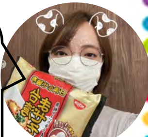
お客様&コーディネーター

ファミマ限定の 紅茶花伝の「ゴロゴロ 果実のフルーツティー」で す。 ゲージリンティーに果物 がゴロゴロ入っていて 満足感があります。