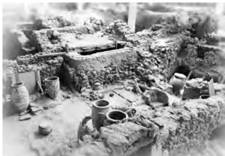
保存状態が良いアクロティリ遺跡

サントリーニ島（ティーラ島とも言われる）はエーゲ海のキクラデス諸島南部に位置する三日月型をした火山島です。夕日やビーチ、古代遺跡など魅力的なスポットが多くあることから、世界中から集まる観光客で賑わう島として知られています。島の中心地フィラは大きな繁華街で、