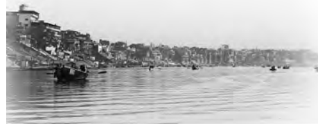
ガンジス川の風景

ラタ」にもその存在は記されているほど。常に多くの人でごった返しており、まるで毎日がお祭りのようだと言われています。神聖さや尊