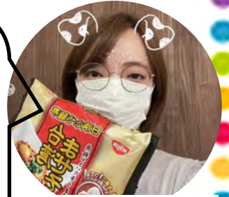
お客様&コーディネーター

桜土浦ICの近くにある「霜降牛ステーキ 千」です。 ここのクリームブリュレが絶品です!