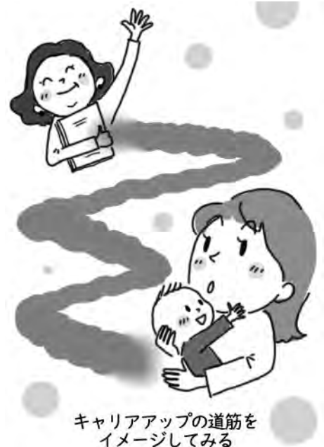
キャリアアップの道筋をイメージしてみる

まずは冷静に自分の5年後、10年後の目標を考えてみます。キャリアアップと子育ての両立は、妥協しなければならないことも出てくるかもしれませんが、途中で変更もあり！と柔軟に捉え、子育てをしながらのキャリアアップの道筋を作る準備を進めてみてはいかがでしょうか？